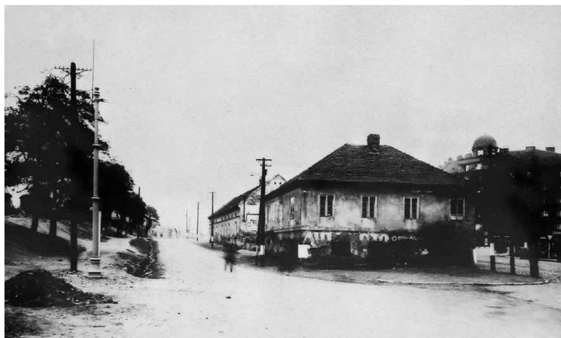
Usedlost Ohrada č. p. 11 dala jméno dnešní frekventované křižovatce, vpravo Hotel Vítkov

Ne, já to tady mám rád, neumím si představit bydlet někde jinde. Na jednu stranu je to město, na stranu druhou můžete jít s dětmi ven a hned jste v zeleni. Chvillemi je to tu jak na vesnici, znáte spoustu lidí kolem.