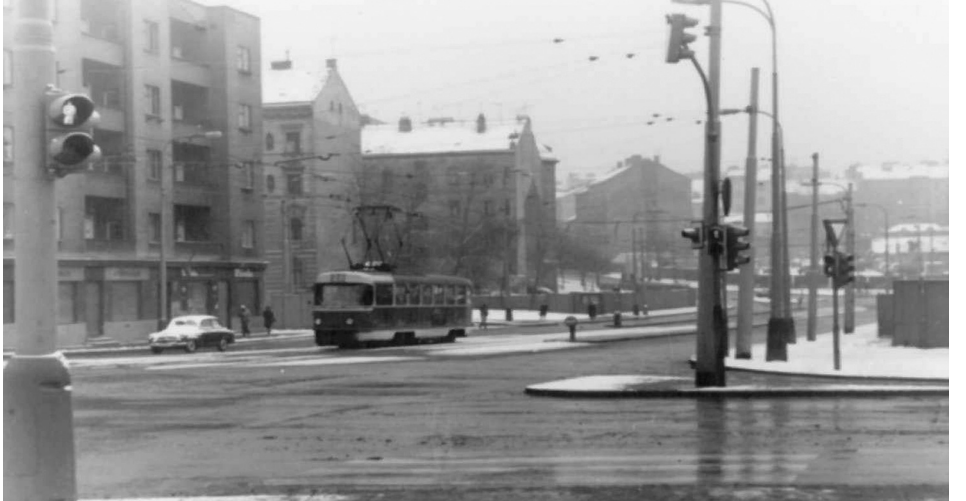
Olšanské náměstí před asanací.

Projít se ve vzpomínkách starým „Olšaňákem“ můžete v sekci www.kauza3.cz/historie-prahy-3