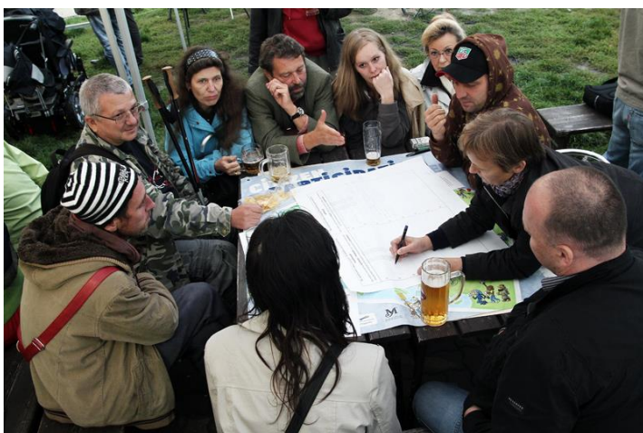
Obr. 2 – Ukázka diskuze ve skupinách

U toho co lidem nevychovuje, měli zapisovatelé u jednotlivých stolů zaznamenat to, co jsou dle mínění občanů nevýhody či problémy hospody a jejího okolí, a měly by se do budoucna odstranit resp. vyřešit . Zato věci, které jim vyhovují, a které se dají chápat jako výhody současného stavu , by měly být do budoucna zachovány . Jednotlivé skupiny tvořilo cca 10 občanů a u každé z nich byl přítomen zástupce ÚMČ nebo pracovník Agory, kteří diskuzi zapisovali do pracovních formulářů.