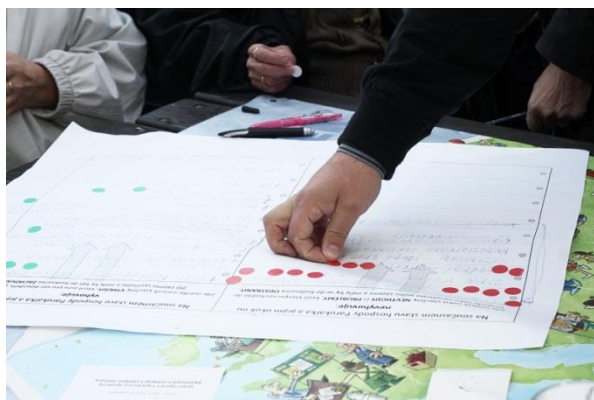
Obr. 3 –Volba prioritních problémů a výhod

Na závěr této diskuze v menších skupinách občané stanovili prioritní problémy a výhody. V každé skupině mohli zvolit, které považují za nejdůležitější. Každý dostal celkem 6 hlasů. Tři z nich mohl přidělit problémům a tři výhodám, které považuje za prioritní.